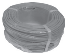
Bus de liaison du CDS Cable type CAELIFLEX 5G0,75. Longueur : 100 ml.